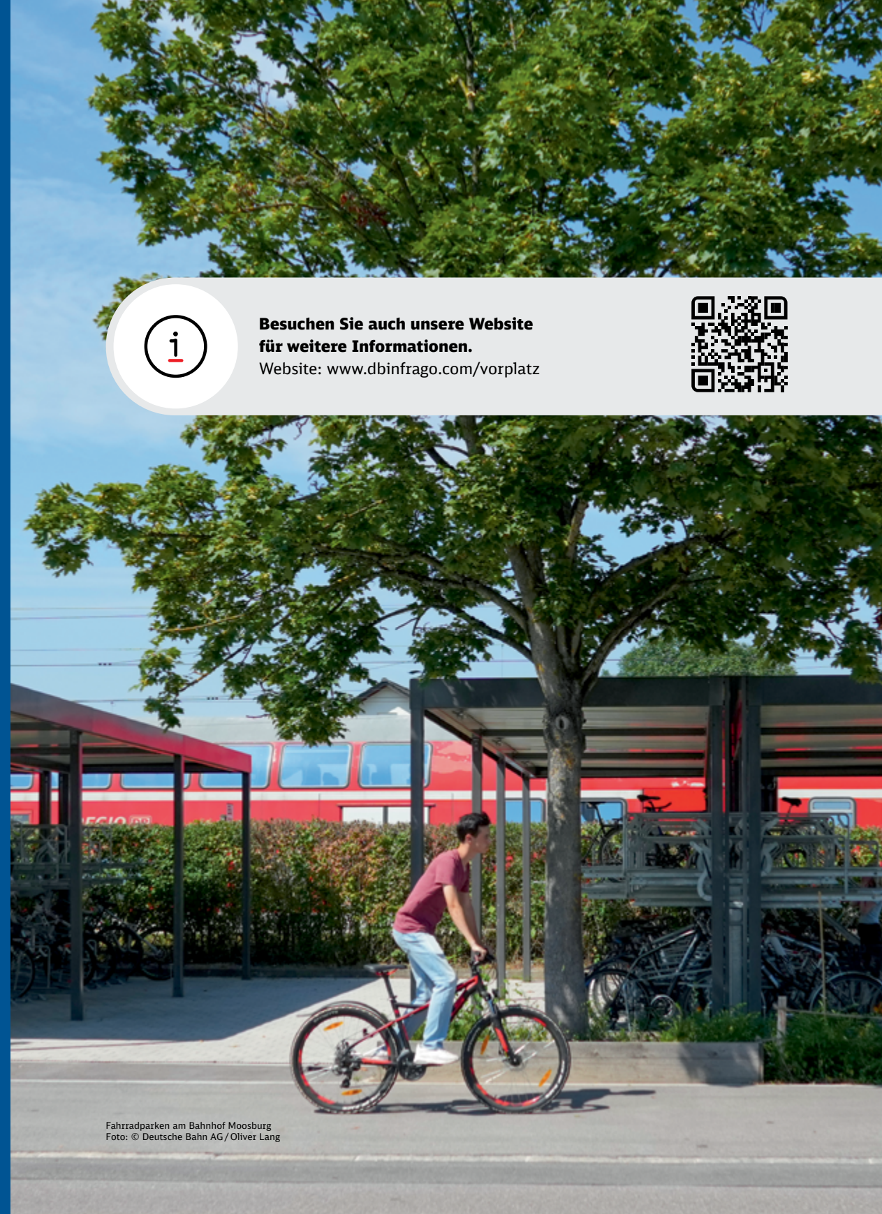
Fahrradparken am Bahnhof Moosburg