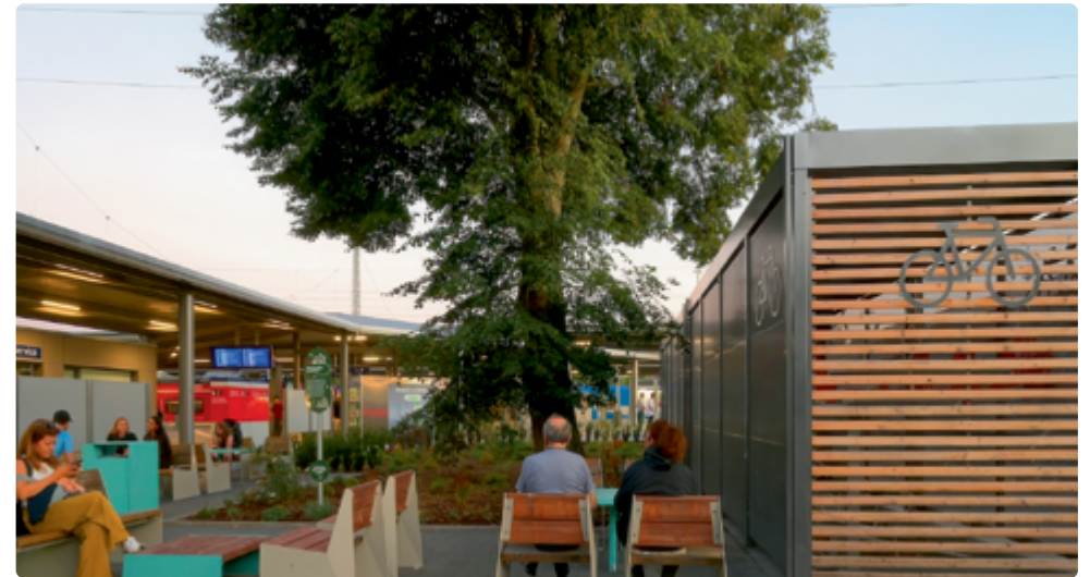
Aufenthaltsqualität, Begrünung und Anschlussmobilität bilden am Bahnhof in Ansbach ein stimmiges Gesamtbild.