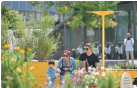
„Freiraum Kits“ als Sitzmöglichkeiten mit bepflanzten Kästen am Bahnhof Köln-Mülheim

Mit uns gestalten Sie Ihren Bahnhofsvorplatz zu einem einladenden Treffpunkt für alle Menschen in Ihrer Kommune – nicht nur zu einem Ort zum Umsteigen. Gemeinsam sorgen wir dafür, dass sich alle wohl und sicher fühlen: Bequeme Sitzmöglichkeiten, gute Beleuchtung, bessere Orientierung durch klare Wegeleitung, Wetterschutz und ansprechend gestaltete Bereiche machen den Aufenthalt angenehmer. Mit mehr Grün, Schattenplätzen und einem cleveren Umgang mit Regenwasser schaffen wir zudem ein besseres Klima auf dem Vorplatz. So wird das Bahnhofsumfeld freundlich, sicher und fit für die Zukunft.