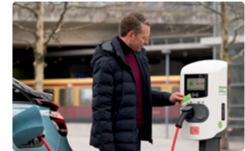
DB Ladestation am Bahnhof Berlin-Südkreuz