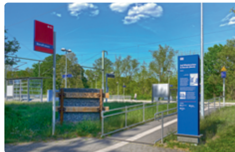
Umfeldstele mit touristischen Informationen sowie einem Bienenhotel am Bahnhof Baruth (Mark)

„Wir freuen uns über die partnerschaftliche Zusammenarbeit mit der DB. Gemeinsam haben wir ein stimmiges Gesamtbild für den Bahnhof umgesetzt.“