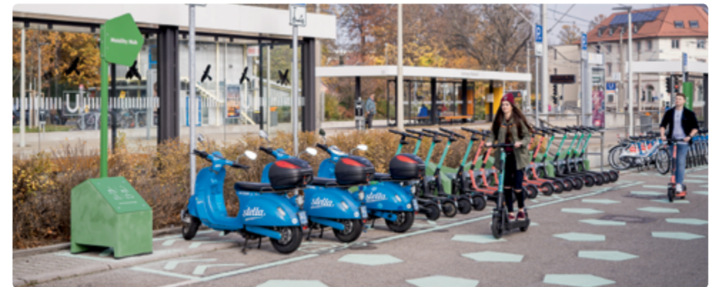
Mobility Hub am Bahnhof Stuttgart-Vaihingen