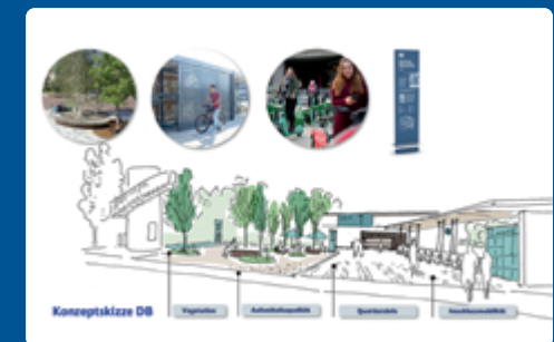
Potsdam-Golm: Aufwertungsmaßnahmen in den Bereichen Aufenthaltsqualität, Vegetation, Quartiersinformation und Anschlussmobilität – Umsetzung voraussichtlich in 2026.