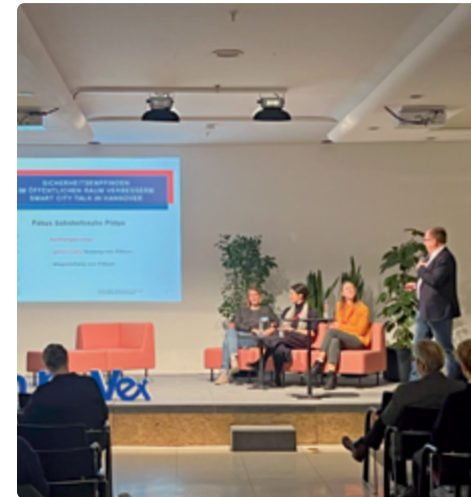
Gemeinsame Veranstaltung mit der Landeshauptstadt Hannover zur Rolle von Bahnhöfen in der Quartiersentwicklung

Fachforen, Städtebauveranstaltungen, regionale Netzwerktreffen und Hackathons bieten Raum für Austausch und neue Impulse. Ihre Themen sind willkommen.