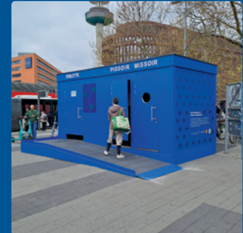
Testphase: barrierefreie Öko-Toilette am Hauptbahnhof in Hannover