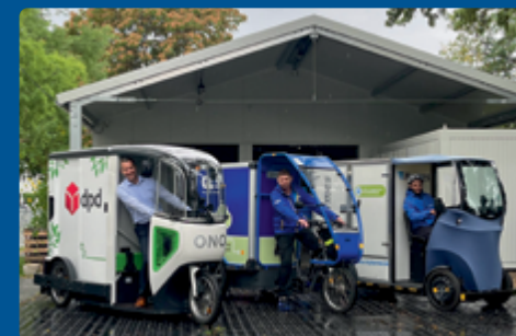
Eröffnung des Micro Depots in Dresden-Neustadt