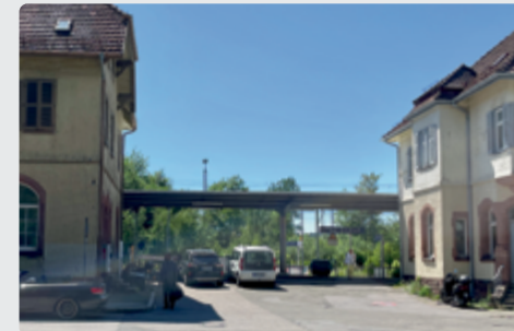
Durch Entsiegelung und Begrünung werden attraktive Orte mit relevanten Angeboten im Bahnhofsumfeld und einem angenehmen Klima an heißen Tagen geschaffen.