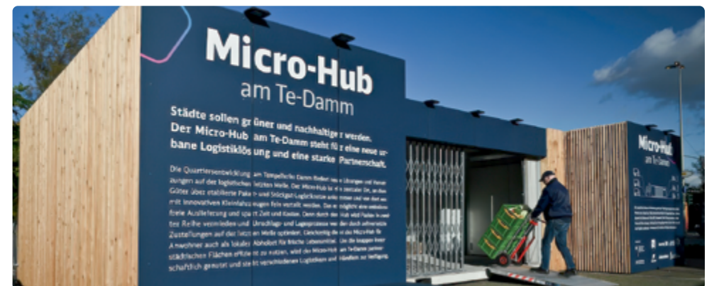
Micro Hub in Berlin-Tempelhofer Damm