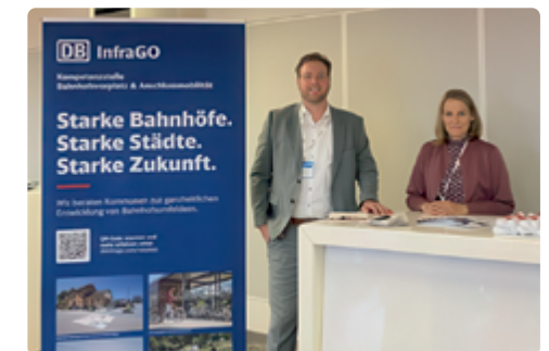
Aussteller auf dem Bundeskongress Nationale Stadtentwicklungspolitik in Rostock 2025