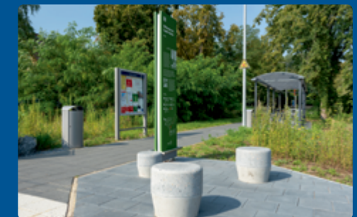
Bahnhofsumfeld in Caputh-Geltow