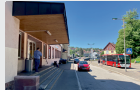
Eine verkehrsfreie, breite Vorplatzzone und barrierefreie Erschließung des Bahnhofsgebäudes steigern die Aufenthaltsqualität am Bahnhof.