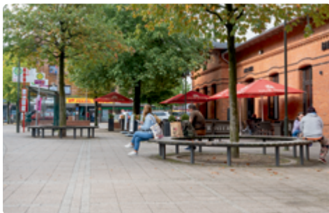
Sitzbänke am Bahnhof Mölln