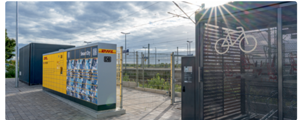
Offene Paketstation am Bahnhof Bitterfeld

Gemeinsam prüfen wir, welche zusätzlichen Angebote an Ihrem Bahnhof sinnvoll sind und wie sie optimal integriert werden können. Beispielsweise machen offene Paketstationen den Bahnhof zu einem zentralen Servicepunkt: Pakete können flexibel abgeholt oder verschickt werden. Durch die Einrichtung von Micro Depots lassen sich Lieferungen für die letzte Meile bündeln, sodass der innerstädtische Verkehr entlastet wird. Beide Lösungen tragen dazu bei, Emissionen zu senken und die Lebensqualität im Quartier zu verbessern.