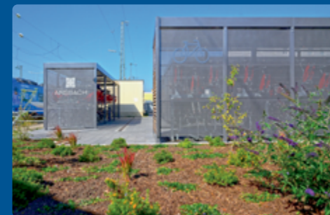
Fahrradparken und Klimaresilienzmaßnahmen am Bahnhof Ansbach

Fernverkehrsbahnhof mit bundesweiten Direktverbindungen.