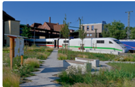
Klimaresiliente Maßnahmen am Bahnhof Hamburg-Harburg