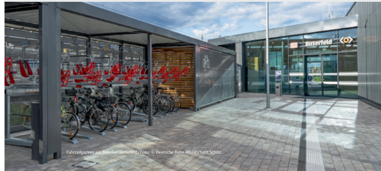
Fahrradparken am Bahnhof Bitterfeld