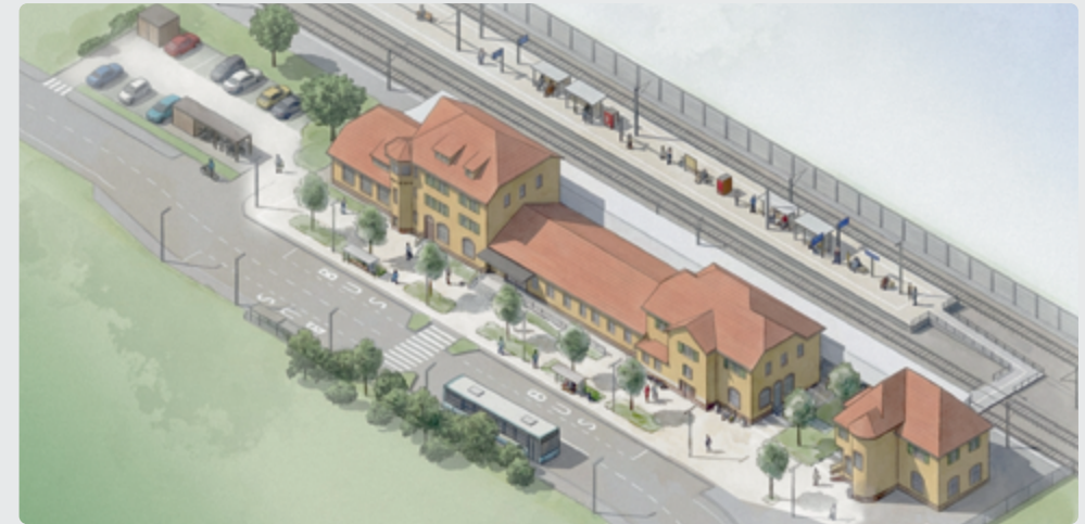
Das Bahnhofsumfeld in Freudenstadt wird auf einer Fläche von rund 8.100 Quadratmetern neugestaltet.

Das Projekt stärkt den Hauptbahnhof in Freudenstadt als Mobilitätsknotenpunkt und urbanen Begegnungsraum – ein Beispiel dafür, wie Kommunen durch professionelle Begleitung von der Projektidee bis zur Umsetzung profitieren können.