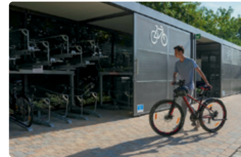
Sammelschließanlage am Bahnhof Cadolzburg

Vernetzte Bahnhofsumfelder ermöglichen den einfachen Wechsel zwischen Verkehrsmitteln und fördern nachhaltige Mobilität. Gemeinsam mit Ihnen bündeln wir Mobilitätsangebote: Fahrradparken, Sharing-Angebote, Park+Ride-Flächen mit Lademöglichkeiten für Pkw sowie Bus- und Tramschlüsse. Darüber hinaus analysieren wir, wie Menschen zu Fuß und mit dem Rad im Bahnhofsbereich sicher und zügig ihr Ziel erreichen. Durch eine kluge Anordnung bleiben Wege kurz, die Orientierung wird erleichtert und der Bahnhof wird zum Knotenpunkt Ihrer Kommune.