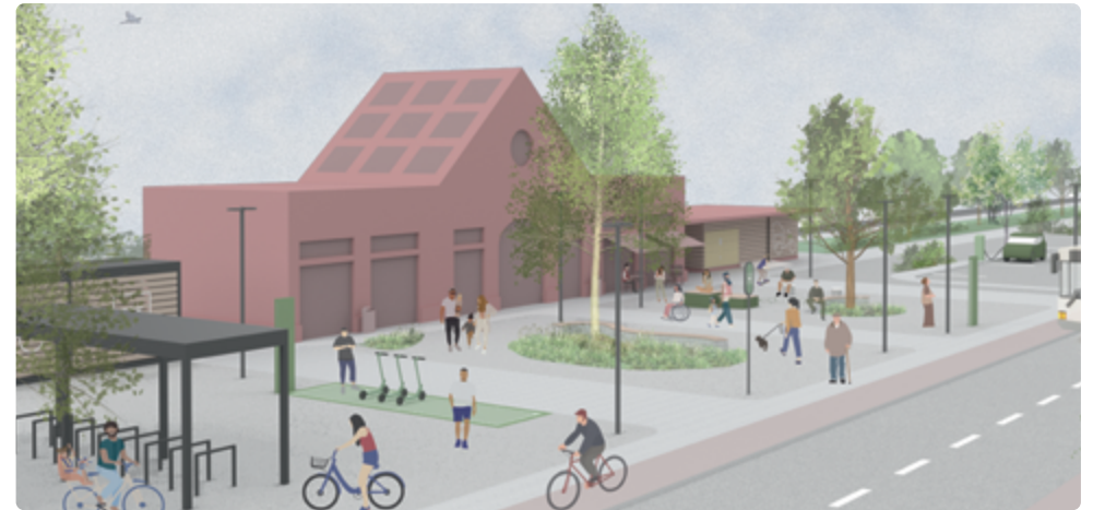
Konzeptskizze für einen Bahnhofsvorplatz: Mit einer ansprechenden und funktionalen Gestaltung lassen sich Bahnhofsumfelder zu attraktiven öffentlichen Räumen weiterentwickeln.