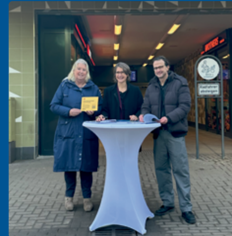
Die DB und die Freie Hansestadt Hamburg verlängern ihre Partnerschaft. Der modernisierte Zukunftsbahnhof Nettelburg zeigt die Wirkung dieser Zusammenarbeit.